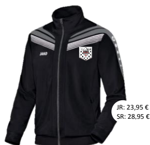
Polyestervest – Art. 9340