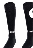
Kous Glasgow 2.0 – Art. 3814