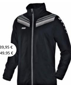
Regenjas – Art. 7440