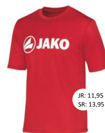
T-Shirt – Art. 6164