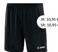
Short Manchester – Art. 4412