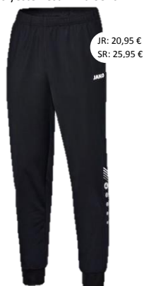
Polyesterbroek – Art. 9240